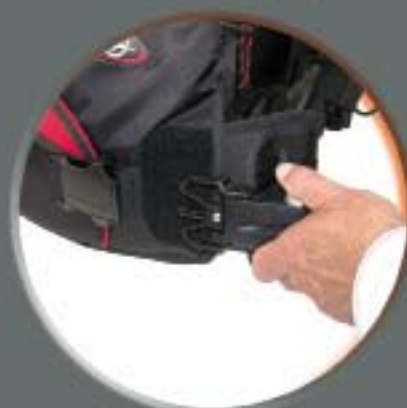
Nouveau système de lestage intégré 2 x 5 Kg