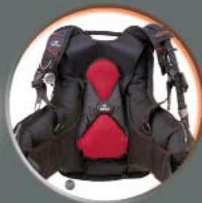
Harnais réglable et renfort lombaire