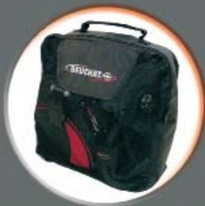
Technologie Poids Plume (taille M : 2,9 Kg) Encombrement réduit : 360 x 410 x 140 mm