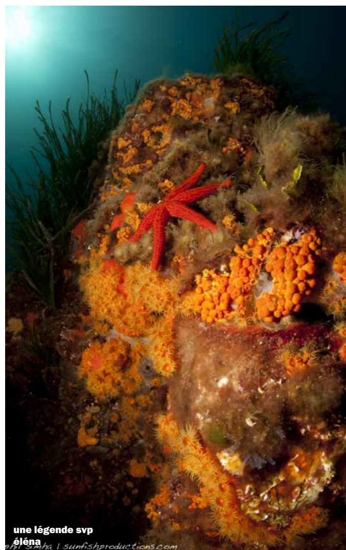
une légende svp éléna