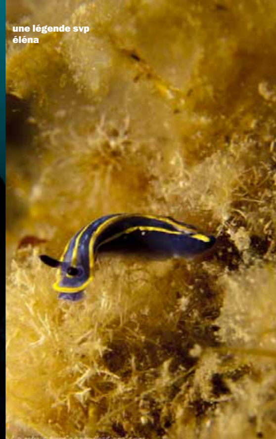
une légende svp éléna