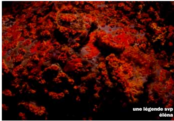
une légende svp éléna

De l'autre côté du golfe, les formations sous-marines des Sardi-naux ont cette fois davantage des allures de tombants coralligènes. Dès les premières minutes sous l'eau, c'est la faune qui mobilise ici l'attention : castagnoles, daurades, sars et saupes s'ébattent entre roches et herbiers, pendant que des nudibranches aussi imposants que l'hypselodoris elegans, le plus grands des nudibranches de Méditerranée, se fraient un chemin le long du récif. Dans une crevasse, c'est un congre qui jette timidement un oeil, surveillé de près par la murène enroulée au fond de l'anfractuosité voisine. Plus bas, un mérou se faufile entre les roches et disparaît rapidement aussitôt qu'une approche est tentée. Au fur et à mesure de la remontée progressive, les poissons papillonnent dans le bleu