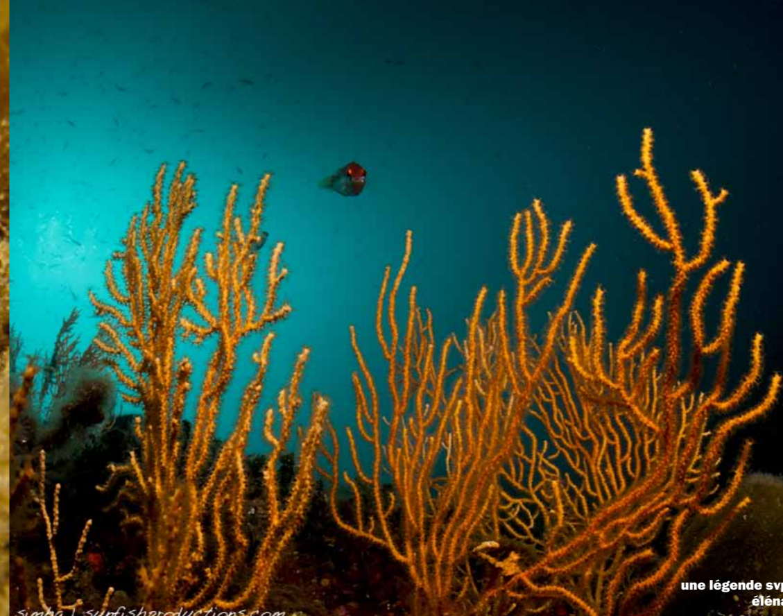
une légende svp éléna