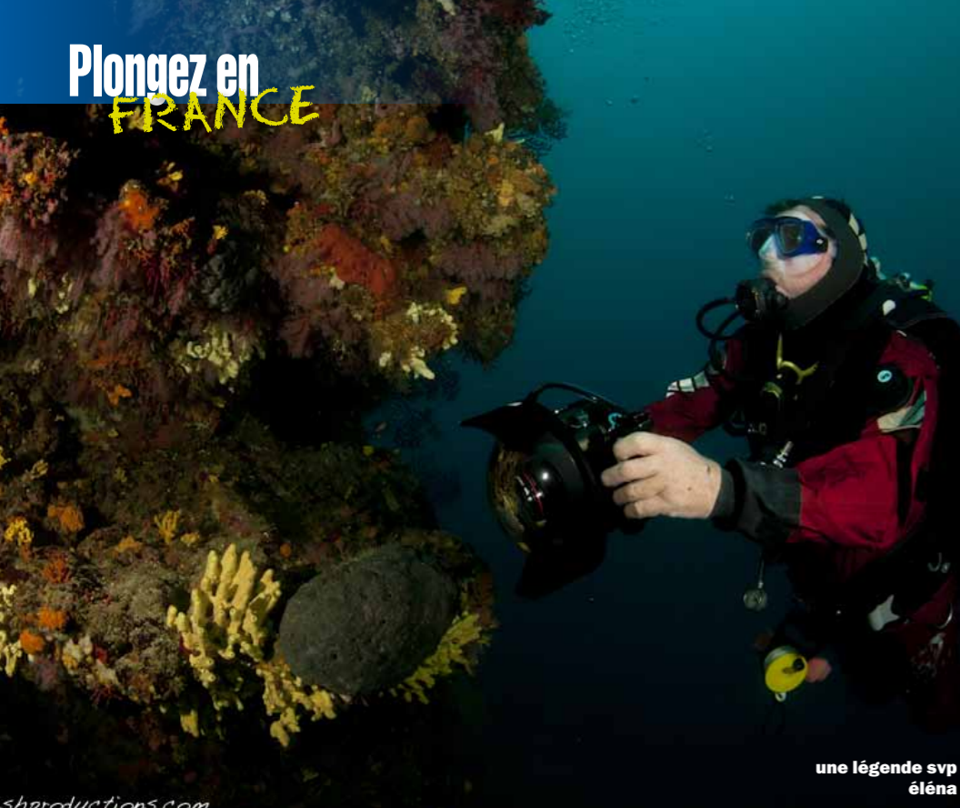
une légende svp éléna