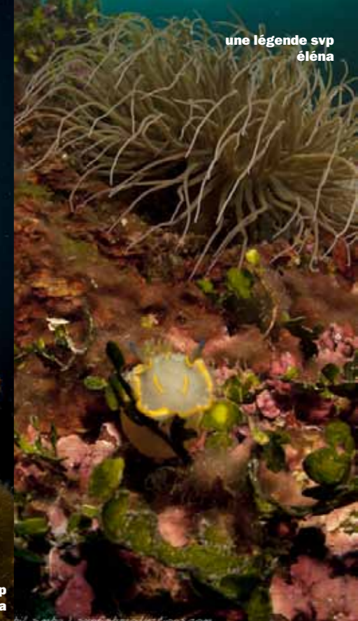
une légende svp éléna